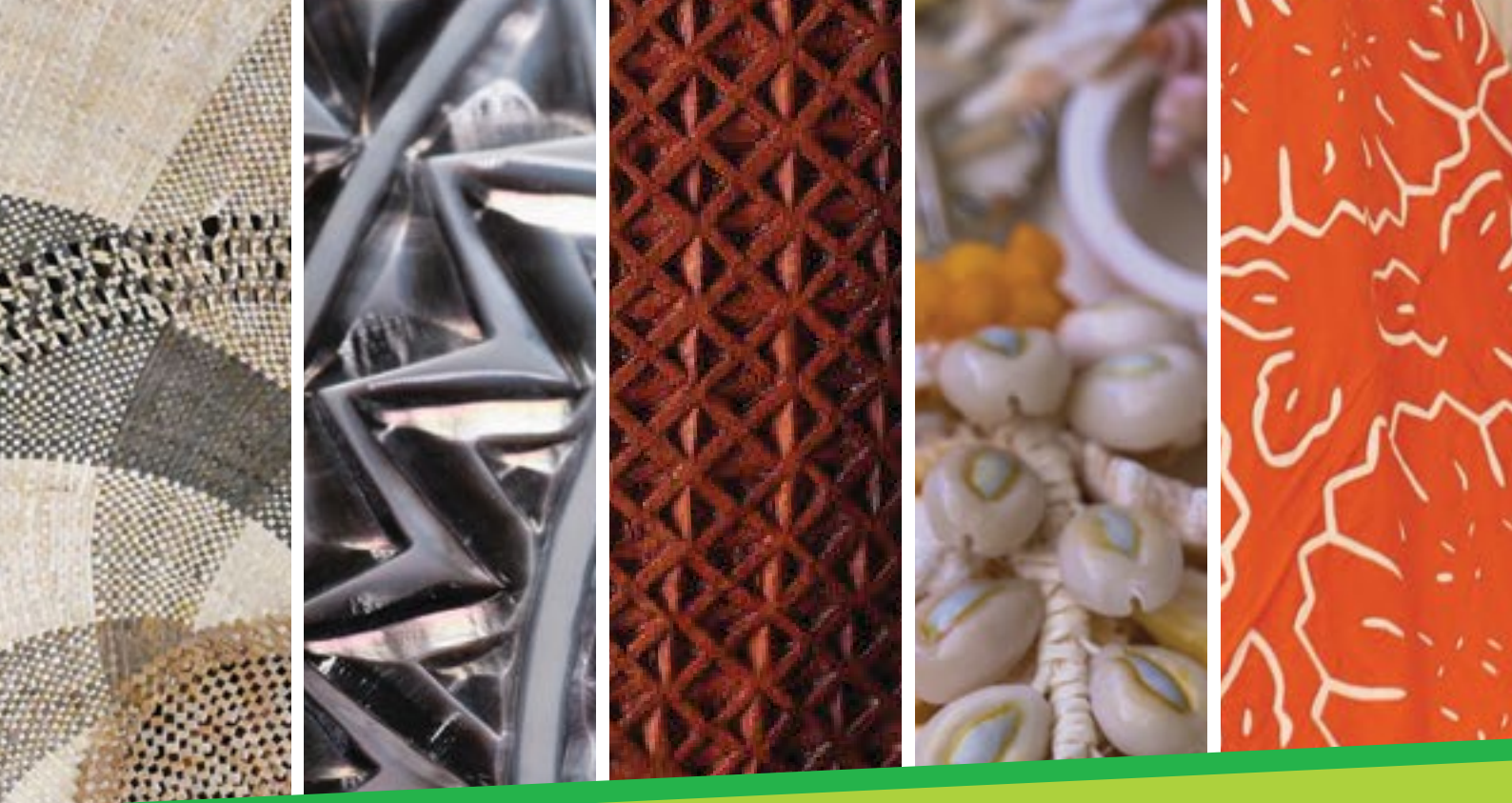
Schéma directeur de L'ARTISANAT TRADITIONNEL PUTA ARATA'I NŌ TE RIMA'Ī PEU TUMU