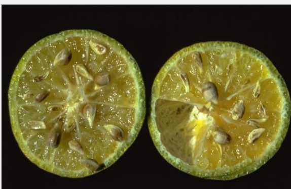
Nécroses brunes sur graines