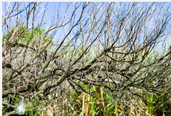
Défoliation et dessèchement