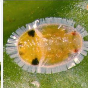
Adulte et larve de Trioza erytraea

Remarque : HLB ne se transmet pas par les semences ni les fruits (attention au pédoncules).