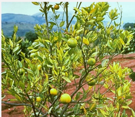
Symptômes sur plants