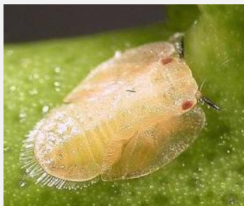
Adulte et nymphe de Diaphorina citri