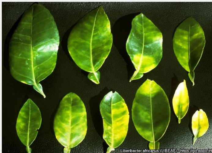
Symptômes sur feuilles