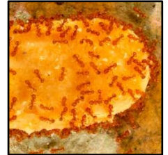
Fourmi sur appât au beurre de cacahuète