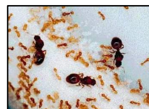
Reines et ouvrières