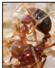
Combat entre une fourmi de feu et une fourmi folle

La petite fourmi de feu est particulièrement agressive avec les espèces concurrentes, elle évince les autres espèces de fourmis environnantes et se nourrit d'insectes et de petits vertébrés. Les animaux vivants dans les mêmes habitats évacuent les zones infestées.