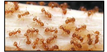
Ouvrières d'une colonie de fourmi de feu