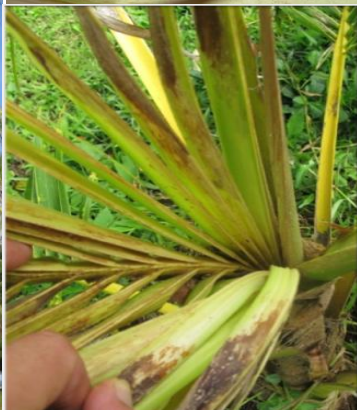
Adultes (0,7-1 cm)