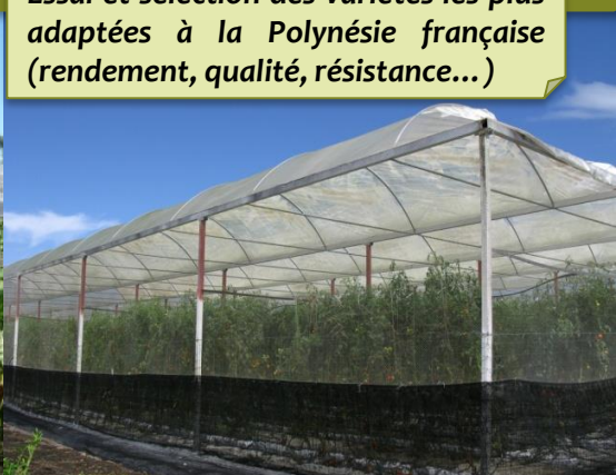
Plantes maraîchères (poivron, melon, tomate, carottes...)