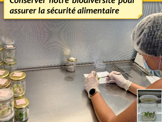
Culture in vitro