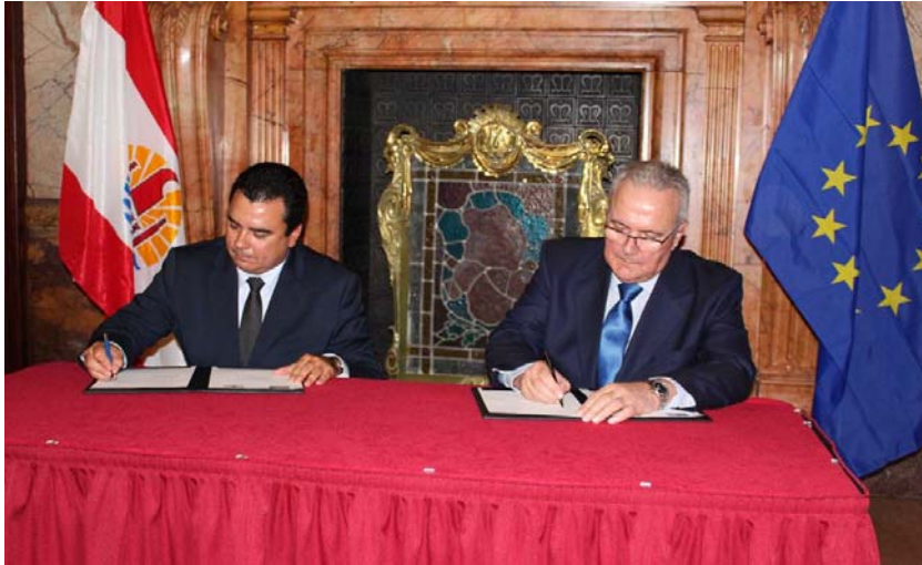
BRUXELLES – Convention de financement pour l'11 ème FED territorial