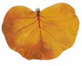
Rau'ere vine tātahi

E 'āfa'ihia teie tumu rā'au nehenehe e te haumarū. E tupu i tātahi e e au tō na mā'a i te vine, nō reira te 'ioa o te tumu, 'aita rā te mā'a e 'amuhia. E rau'ere nehenehe e te pa'ari ri'i e te 'ā'ano.