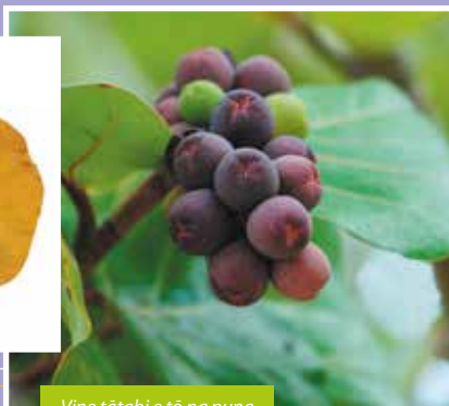
Vine tātahi e tō na pupa