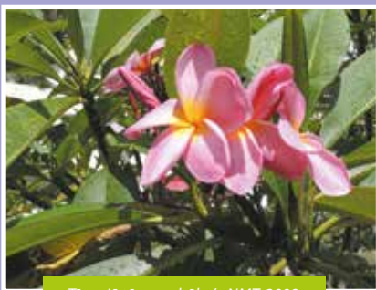
Tīpaniē tārona, hōho'a NMT, 2009.

Teie te tahi nau rā'au-ō-'āpī-mai e tupu nei i 'Ōpūnohu i Mo'orea.