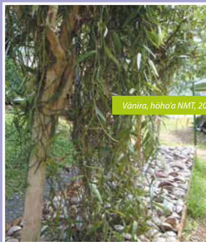
Vānira, hōho'a NMT, 2009.

E 'āfa'ihia teie tumu rā'au i te ārea matahiti 1815. E fa'a'ohipahia te raue'ere nō te 'āmaha-hītoto, te he'a, e hou e pohehia ai te vahine i te ma'i 'āva'e. E 'amu te tamarī'i i te mā'a hotu, ia 'amu rahi rā e tumau.