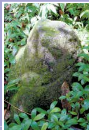
Ti'i nō te fa'a nō 'Ū'ufau i Mo'orea