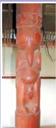
Tiki rapa nui, Fare ia manaha nō Atu'ona, Hiva'oa, fenua 'enata

« la 'ōpua te feiā tahutahu e tāpū i te hono e nati ra ia na i te ti'i 'aore ra i te mau ti'i, e tanuhia te ti'i e rātou i te tahi vāhi 'ōmo'emo'e. Hou te ti'i a tanuhia ai, e upuhia tō na vārua i fa'aru'e i te ao nō te ho'i i te pō. E parauhia e fa'aru'e-ti'i. I te tahi taime, e ha'uti te vārua i te tahu'a e tō rātou mau feti'i e e ta'a ia rātou ē 'aita te ti'i e au i tō na vāhi tanura'a; e 'imi ia te tahu'a i te vāhi tano ia topa te hau. I te taime i fa'aru'ehia ai te ha'amorira'a ti'i, ua mau teie mau peu, i fa'aue ai te tahu'a e tanu i te mau ti'i ato'a, 'eiaha re'a ia riro i roto i te rima ō te papa ā ». (Henry, 2004 :216) ♦