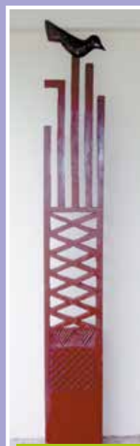
Unu nō te rupe (Ducula aurorae), Tahiti, 2015