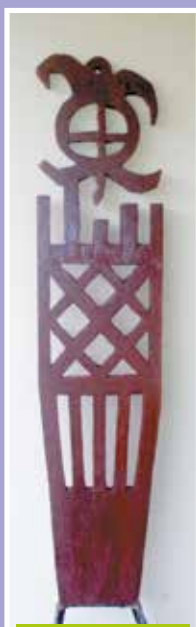
Unu nō te honu ari'i, Raromata'i, 2015