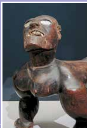
Ūmete tiki nō Vaihi, fa'a'itera'a Te atua nō te National gallery nō Canberra, Auterarā, 2014