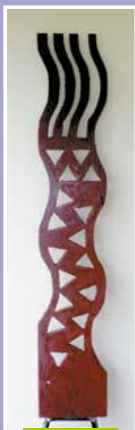
Unu nō te tai, Tahiti, 2015

« I Porinetia mā, e fa'a-tū'atihia te huru ō te mau animara e te huru ō te mau atua, 'ārea i te fenua Afiritā rā, e fa'atū'atihia te huru ō te mau 'ānimara i te huru ō te mau tupuna ». (Lévy-Strauss, 'ah'e Totémisme et pensée sauvage, 1984 :42)