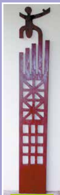
Unu nō te nai, Tahiti, 2015