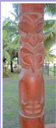
Tiki vanuatū, Fare ia manaha nō Atu'ona, Hiva'oa, fenua 'enata