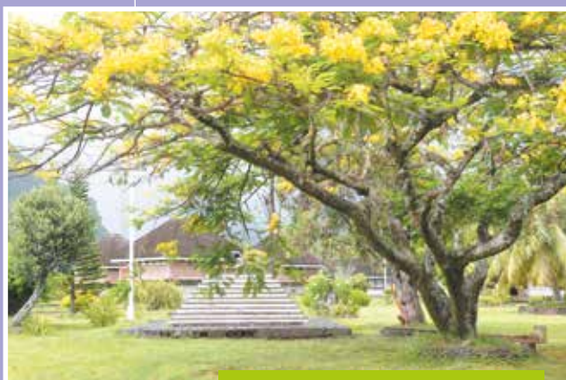
E mea māre'are'a te pua ō te tumu marumarū

- matie : vert, amande, avocat, menthe, Chartreuse, émeraude, flave, glauque, olive, sinople héraldique, vert bouteille, vert céladon, vert d'eau, vert-de-gris, vert de Hooker, vert de vessie, vert épinard, vert impérial, vert lichen, vert perroquet, vert poireau, vert prairie, vert printemps, vert sauge, vert tilleul, viride.