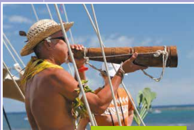
E mea hiri, e mea kāki teatea te pū rā'au

Teie te mau 'ū e fa'ahitihia mai i ni'a i te reini natirara Wikipedia i roto i te reo farani; 'aita te reo tahiti e fa'ahiti i te mau taiha'a 'aore ra mā'a 'ite'ore i Tahiti; e mau ta'o nō te mātāmua e te tahi mau ta'o 'āpī.