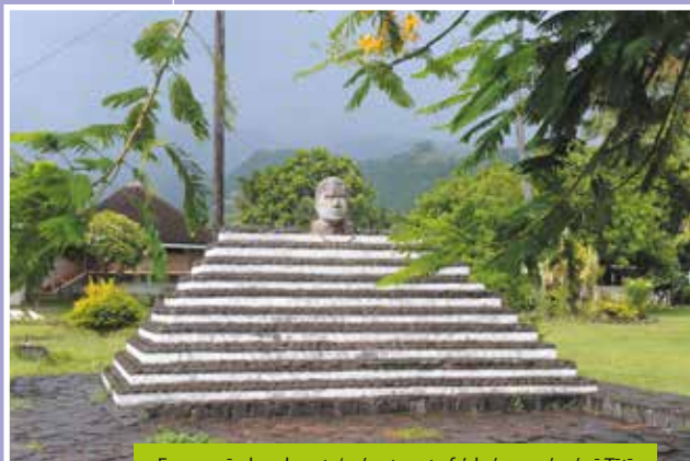
E mea mārehurehu e te 'uo'uo te patu fa'aha'amana'ora'a ō Tātī