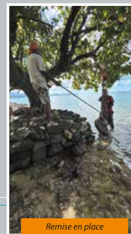
Remise en place de la pierre d'angle