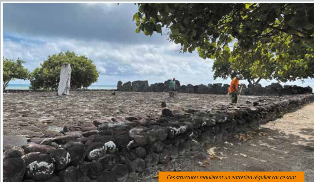
Ces structures requièrent un entretien régulier car ce sont des constructions en pierres sèches édifiées sans mortier.

HIRO'A JOURNAL D'INFORMATIONS CULTURELLES