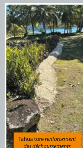
Tahua tore renforcement des déchaussements