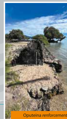
Oputeina renforcement et alignement de dalles de corail