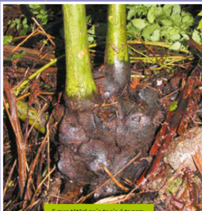
E mea tōtōrā pa'ō te a'ō te para.