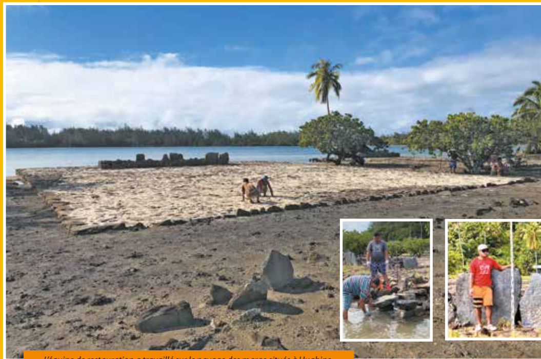
L'équipe de restauration a travaillé sur le pavage des marae situés à Huahine.

RENCONTRE AVEC MARK EDDOWES, ARCHÉOLOGUE ET BELONA MOU DE LA DIRECTION DE LA CULTURE ET DU PATRIMOINE. TEXTE : LUCIERA BRÉAUD