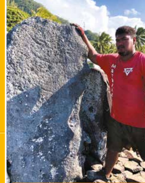
Le nouveau pétroglyphe de la pirogue double (sacrée) côté nord du ahu.