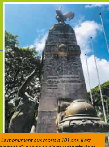
Le monument aux morts a 101 ans. Il est composé d'un socle en pierre reconstituée et d'une statuaire en bronze (depuis 2003).

« Il va falloir décontaminer le monument en appliquant un biocide qui est d'un