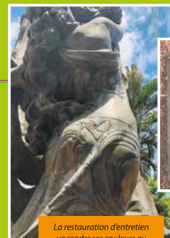
La restauration d'entretien va rendre ses couleurs au père de la Marianne.