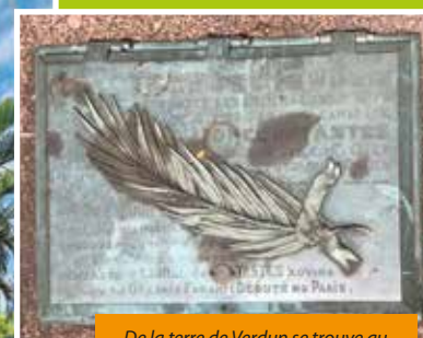
De la terre de Verdun se trouve au pied du monuments aux morts. La plaque va être nettoyée.

nouveau type. Il y a eu une petite partie recherche-étude pour appliquer le meilleur. Ce gel, mis au point récemment, est recommandé par le Laboratoire de recherche des monuments historiques (LRMH) pour la restauration des œuvres et monuments en calcaire et en marbre. Il est aussi compatible avec l'agriculture biologique et donc pas nocif pour l'environnement. »