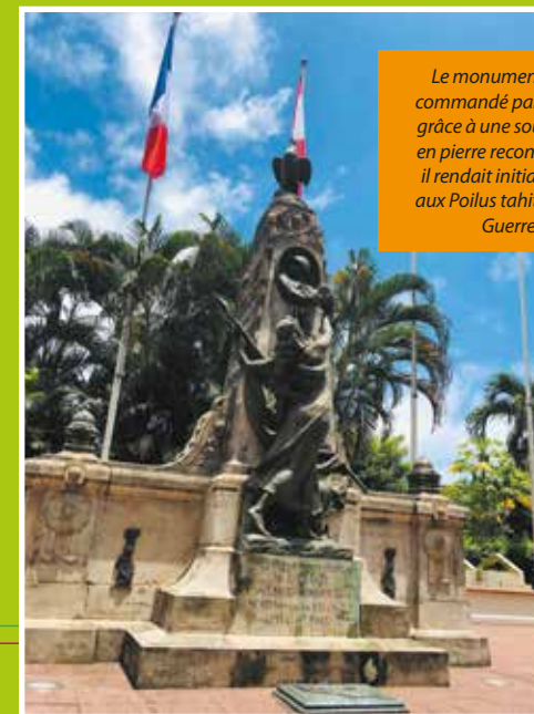
Le monument aux morts a été commandé par la ville de Pape'ete grâce à une souscription. D'abord en pierre reconstituée et en plâtre, il rendait initialement hommage aux Poilus tahitiens de la Première Guerre mondiale.

« Pas tout à fait. Je me suis rapproché de la ville de Pape'ete qui possède des documents sur le monument aux morts et des panneaux d'exposition. Ils seront visibles pendant la durée du chantier. Les passants pourront ainsi en apprendre un peu plus sur son histoire. D'ailleurs, si certains ont des archives personnelles, et notamment à propos des deux déménagements du monument, je suis preneur. » ♦