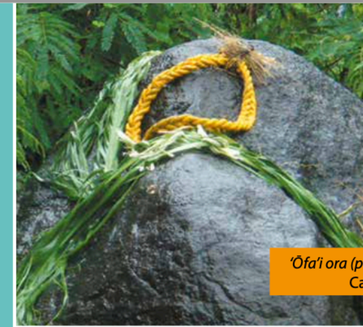
‘Ōfa‘i ora (pierre de vie)