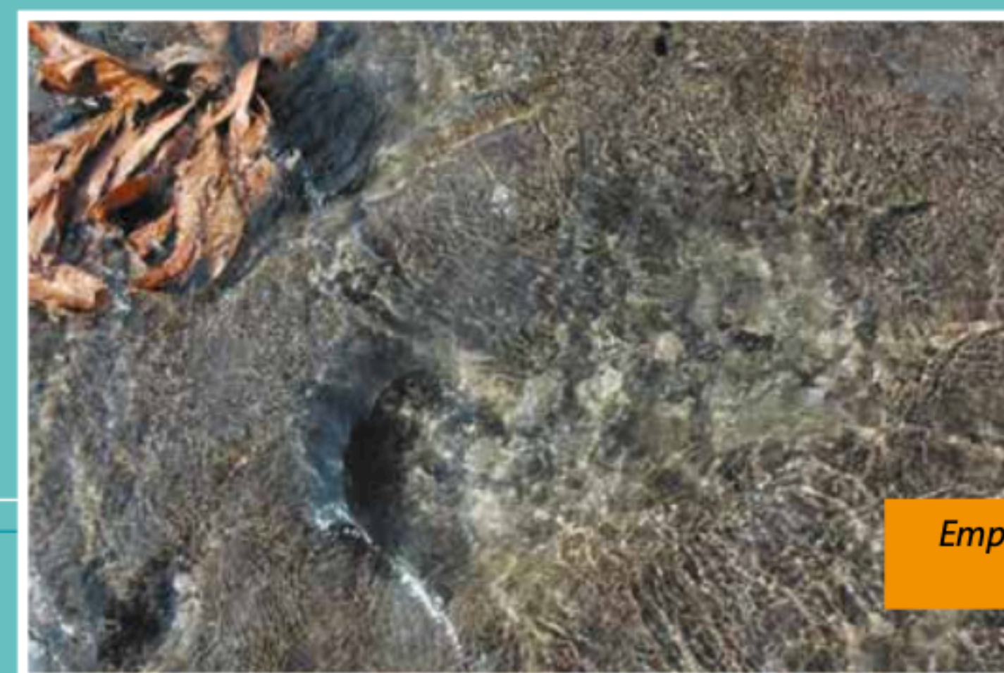
Empreinte de Pai, Dany Carlson, 2008, ©Collection particulier.

Tout d’abord, on y trouve trois sources sacrées, déjà évoquées plus haut. La première, Puna‘au, également connue sous le nom de Vai-aitu, est associée aux rituels funéraires et à la purification. Elle aurait accueilli les âmes arrivant par le sud. La seconde, Vai-tupa-rere (ou Vai-tupa), était réservée aux défunts adultes dont l’âme provenait du nord. Enfin, la source Vaira‘i, aujourd’hui disparue en surface, aurait également accueilli les âmes venues du nord. Autre élément fondamental du site : la falaise Te Hi‘u. Cette portion de la montagne Tāta‘a plonge directement dans la mer et matérialise précisément le point d’envol des âmes. C’est au pied de cette falaise, sur le platier corallien immergé, que l’on trouve l’empreinte de pied de Pai-ā-Ra‘i, héros mythique qui transperça la montagne Mou‘a-tapu de Mo‘orea. Depuis cet événement, la