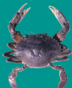
Crabe vert UPAI

Taille minimale autorisée / faito nai'nai fa'ati'a hia : 12 cm