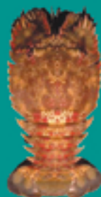
Cigale de mer TIANEE

Taille minimale autorisée / faito nai'nai fa'ati'a hia : 14 cm