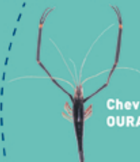
Chevrette OURA PAPE

Taille minimale autorisée / faito nai'nai fa'ati'a hia : 6 cm