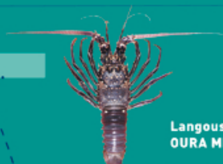
Langouste OURA MITI

Taille minimale autorisée / faito nai'nai fa'ati'a hia : 12 cm