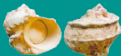
Burgau MAOA TARATONI