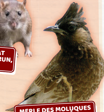
MERLE DES MOUQUES & BULBUL À VENTRE ROUGE