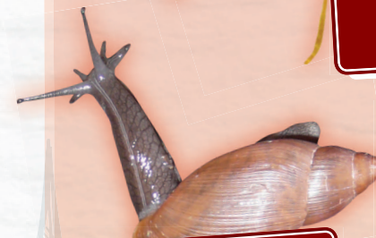
ESCARGOT CARNIVORE EUGLANDINE