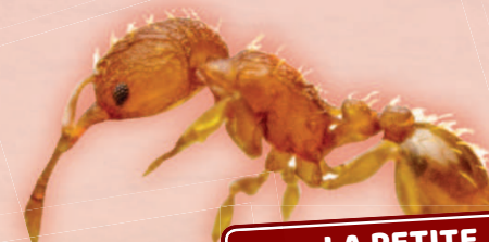
LA PETITE FOURMI DE FEU (PFF)