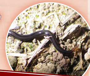
VER DE NOUVELLE-GUINÉE