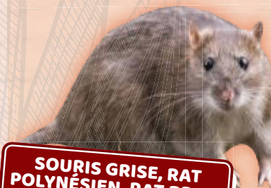
SOURIS GRISE, RAT POLYNÉSIE, RAT BRUN, RAT NOIR