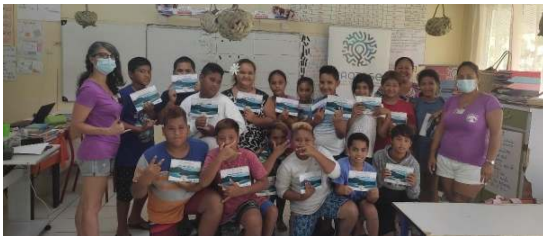
Classe CM1-CM2 de l'école primaire d'Opoa

A l'occasion des interventions au sein des écoles de Ōpōa et Puohine, les premières distributions du guide ont été effectuées.