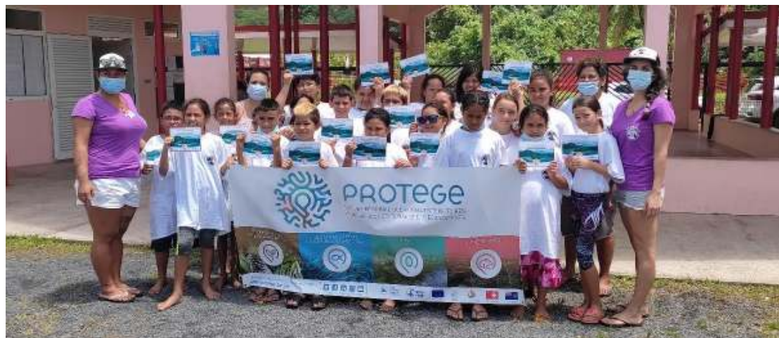
Classe de CE1-CE2-CM1-CM2 de l'école primaire de Puahine

Pour plus d'information, vous pouvez contacter l'auteur de l'article, Raimana TERITEHAU , Animateur du thème « Espèces envahissantes » pour le Paysage culturel de Taputapuātea inscrit au Patrimoine mondial de l'Unesco