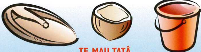
TE MAU TATÂ