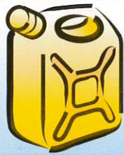
TE MORI ARAHU