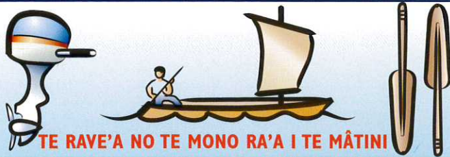
TE RAVE'A NO TE MONO RA'A I TE MÂTINI