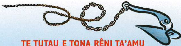
TE TUTAU E TONA RÊNI TA'AMU