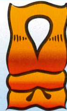
TE MAU RAVE'A NOTE FA'A ARA RA'A I TE MAU FIFI