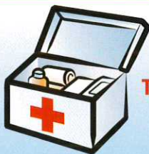
TE VAI RA'A RÂAU