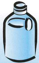
TE MAU POITO