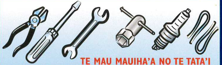
TE MAU MAUIHA'A NO TE TATA'I