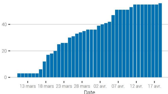
Fig. 1. Rahira'a ta'ata tei ma'i hia i te COVID-19 'i Pōrīnetia farāni nei mai te omuara'a ma'i

No roto mai : Piha hi'opo'ara'a i te mau ma'i, Faaterera'a nui no te ea