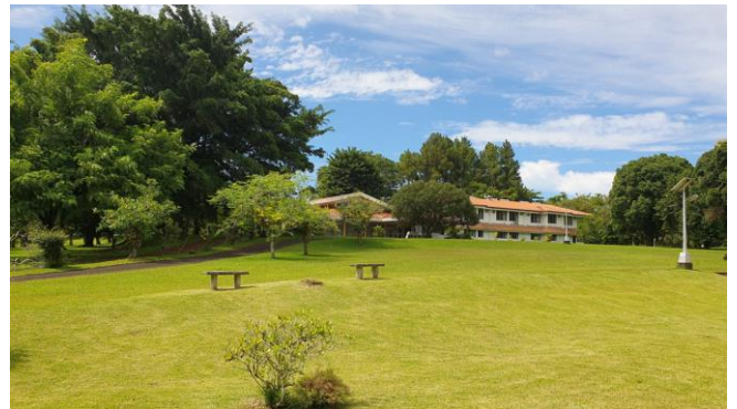
Te Pū nō Mitirapa (Tibériade)

Te mau utuutu ma'i no te Fa'aterera'a o te Ea o te tere atu i roto i te mau Fare Ha'api'ira'a nō te ape'era'a e te tauturura'a i te mau Fa'atere ha'api'ira'a hou teie ha'amatarara'a ha'api'ira'a.