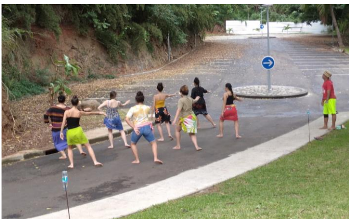
Activités organisées par la Cellule de Crise Covid-19 dans les centres d'hébergement gérés par le Pays

Pour les personnes qui ont été hébergées dans les lieux gérés par le Pays, de nombreuses activités encadrées par la cellule de crise Covid-19 ont été organisées sur place pour rendre cette période le plus agréable possible : conférence sur la culture, la langue et l'histoire polynésienne ; ateliers culinaires, de tressages ou de 'ori Tahiti ; rendez-vous sportifs organisés par les confinés ou par des professionnels bénévoles (cours de yoga, initiation à différentes pratiques sportives, etc).