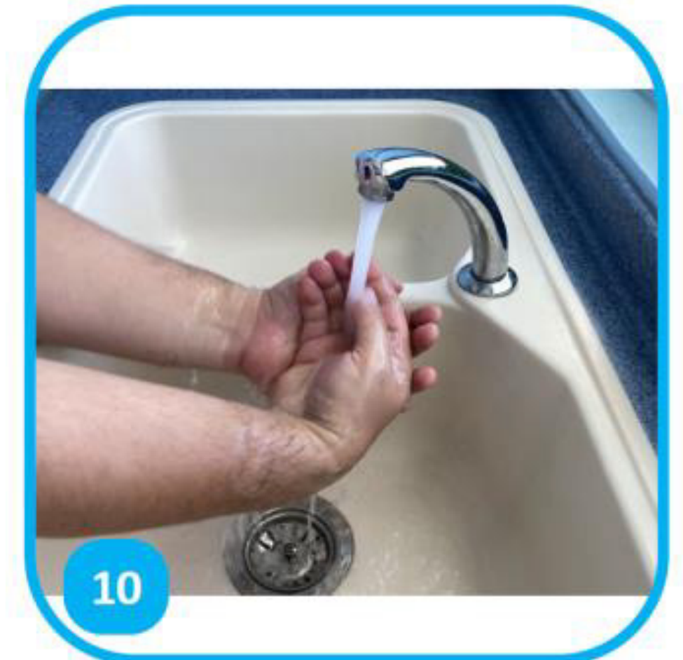
10 Rincer à l'eau sans toucher au robinet