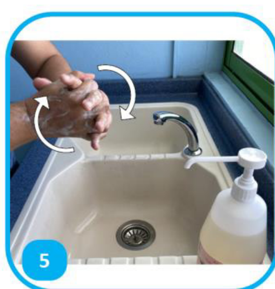
5 Tārau te mau rimarima e a tīoro maita'i