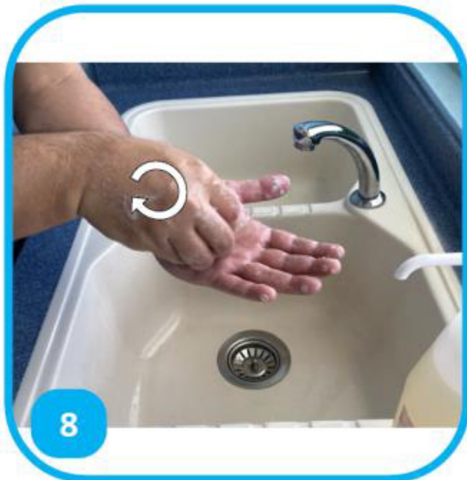
8 Frotter les ongles contre la paume