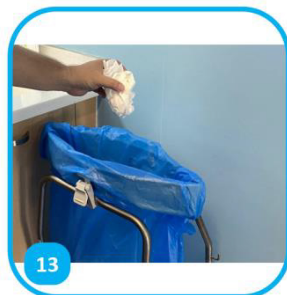
13 Jeter l'essuie-mains dans une poubelle sans contact