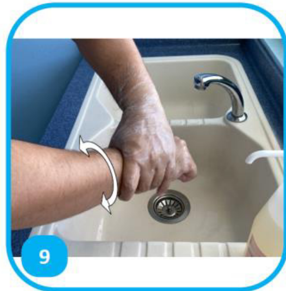
9 Frictionner le tour du poignet