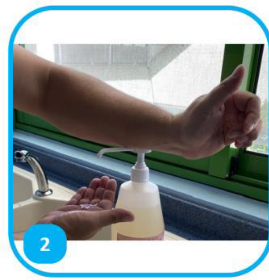
2 Rave 1 miriritera pu'a