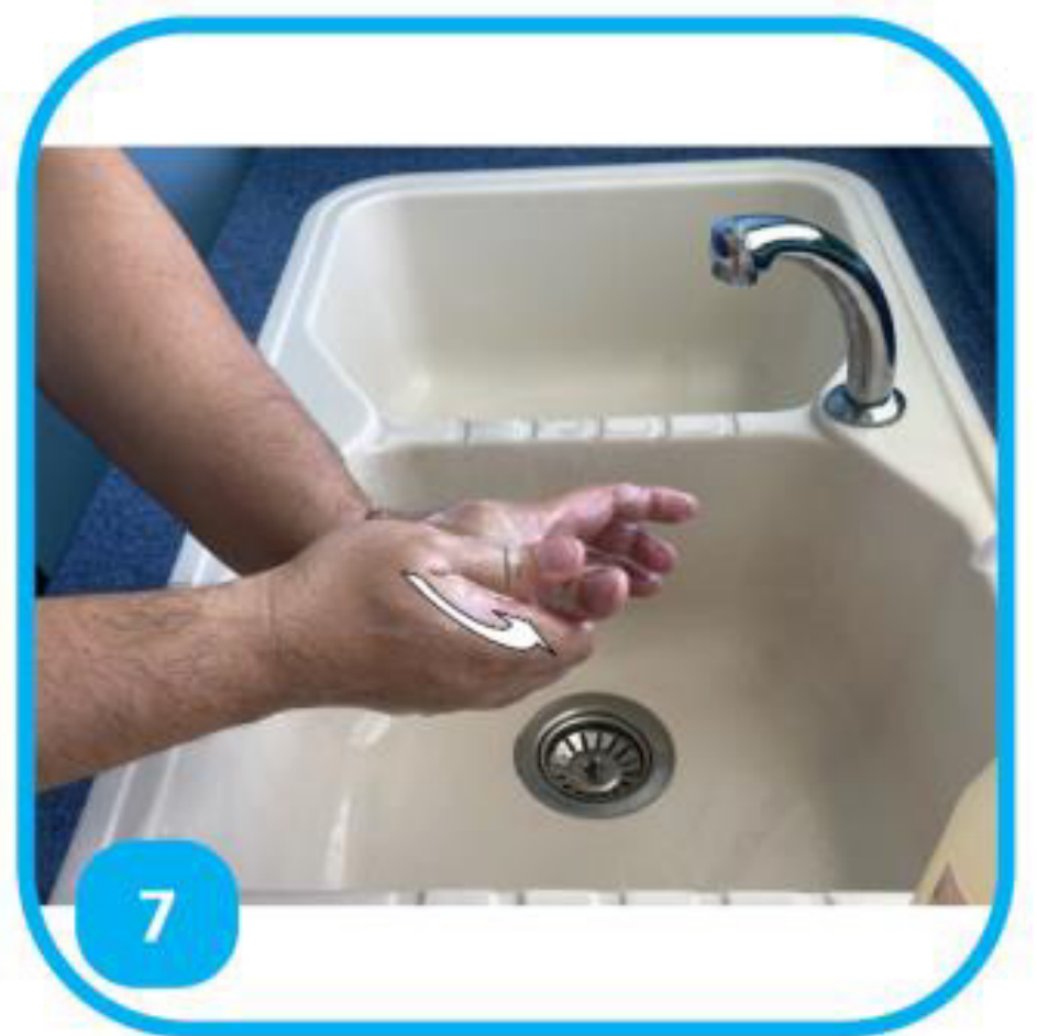
7 Frotter la surface des pouces