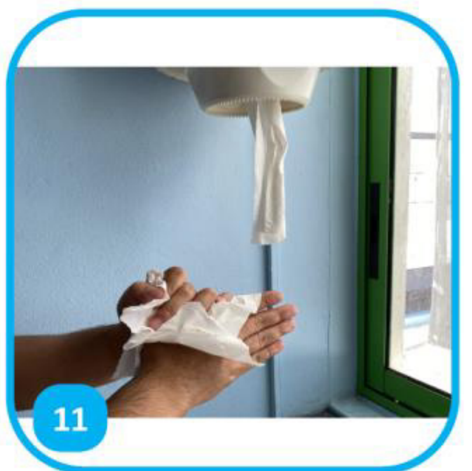
11 Sécher avec un essuie-mains à usage unique