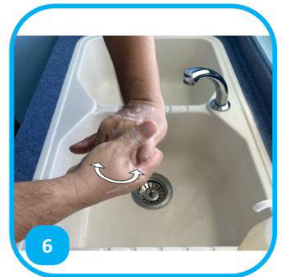
6 Frotter tous les plis des doigts