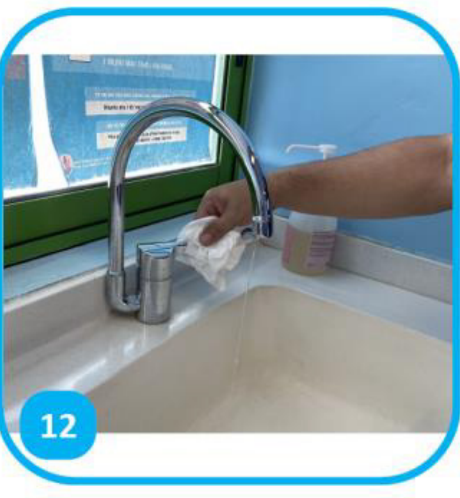
12 Tāmau te pape ma te fa'aohipa i te horoi papie