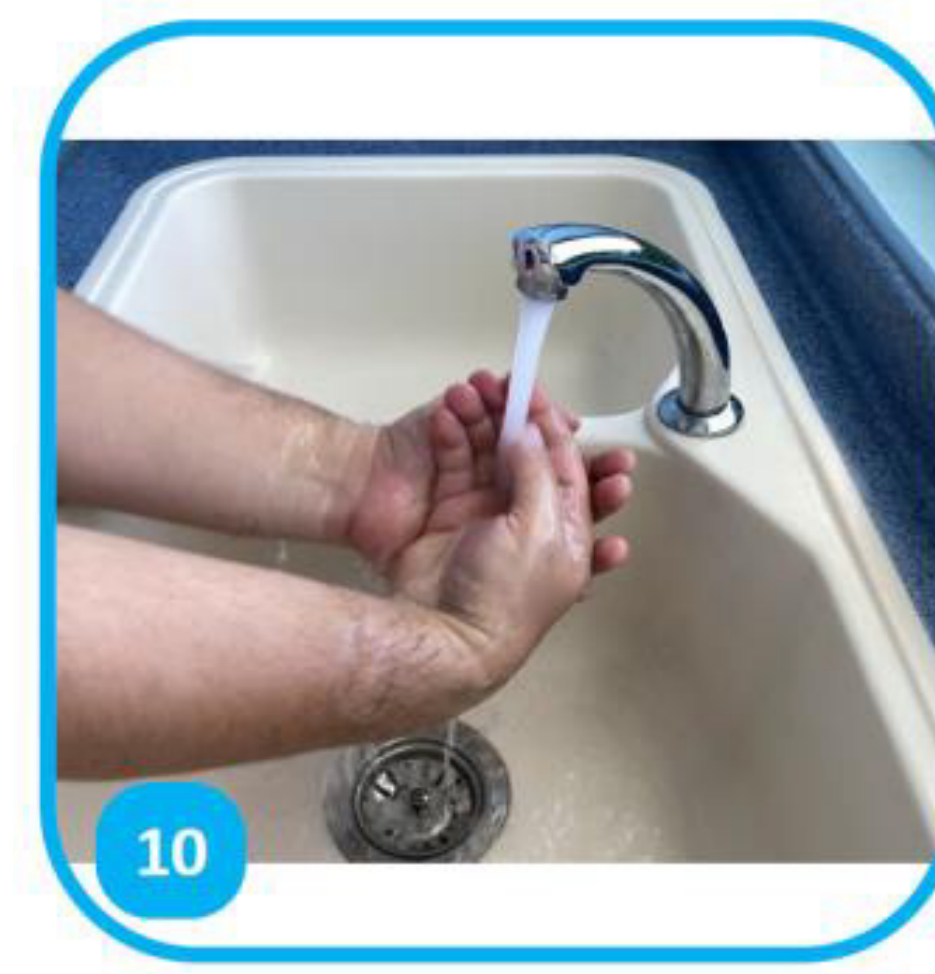
10 Tāmā i te pape, eiaha e tapea i te ropine