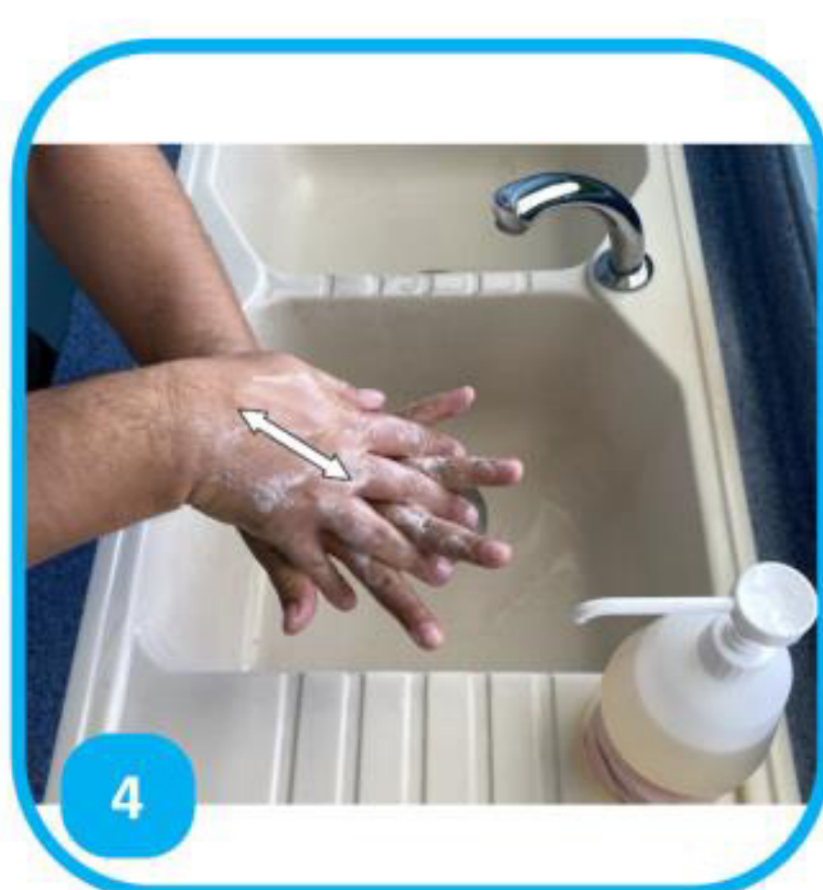
4 Tīoro te tua o nā rima tata'itahi