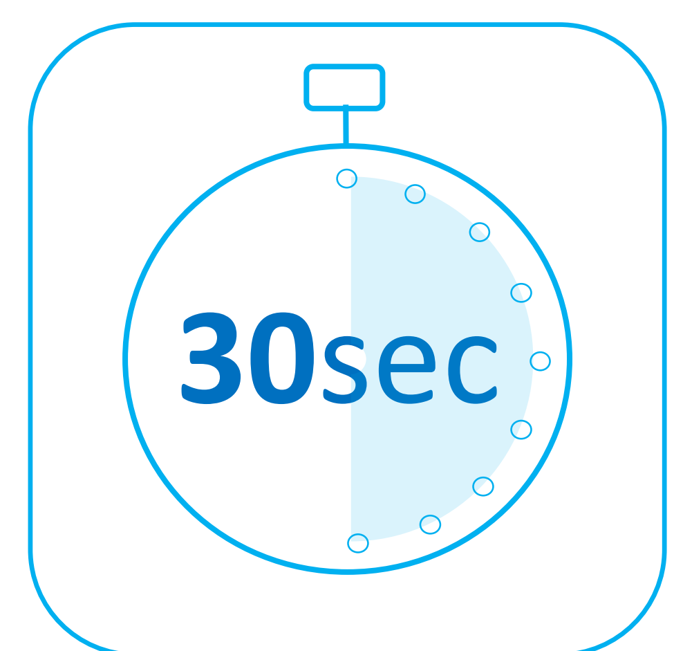
Respecter une durée totale d'au moins 30 secondes