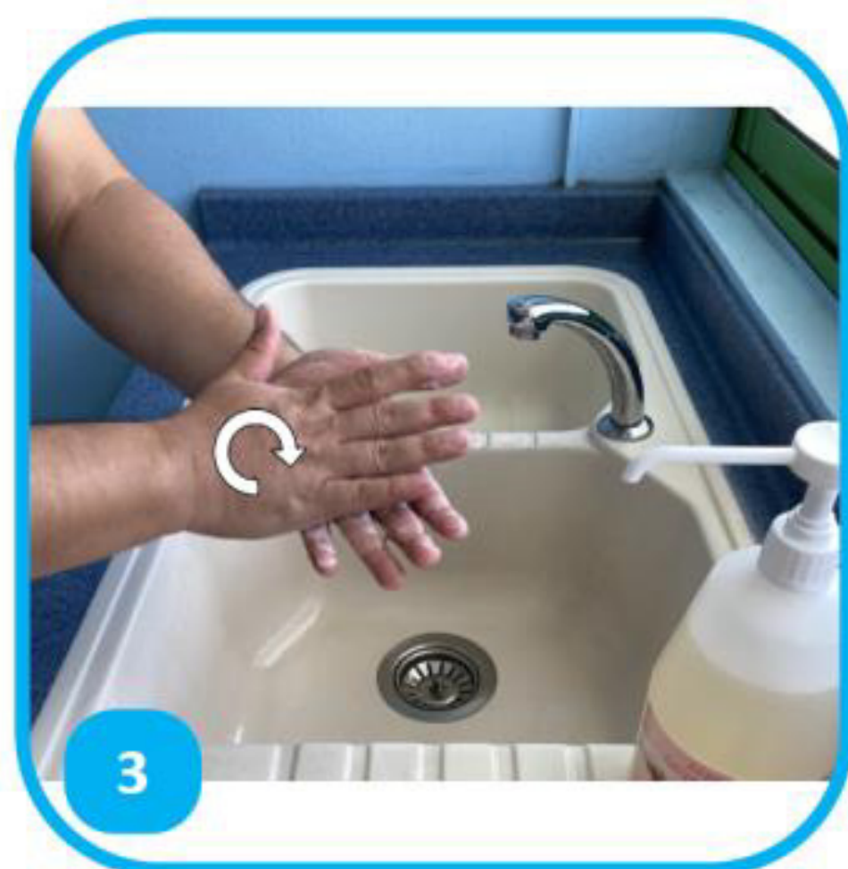
3 Ha'aparare i te pua ma te tapiri i nā 'apu rima