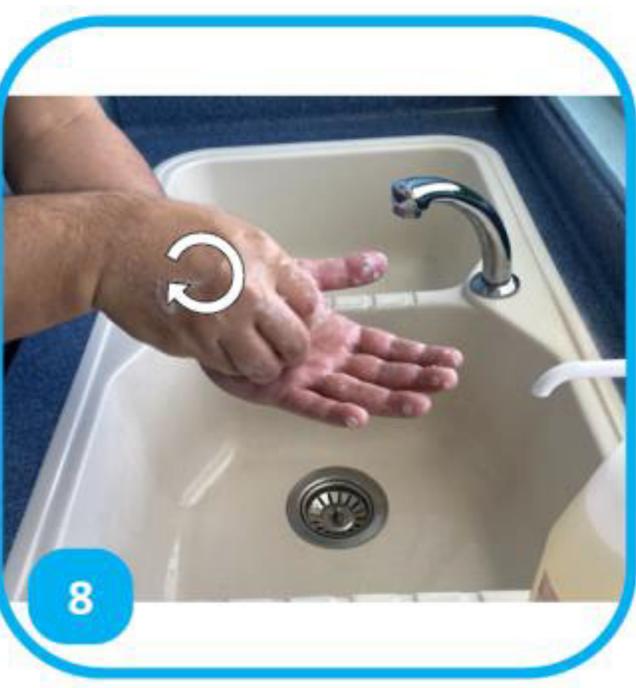
8 Tīoro te mau mai'u'u i roto i te 'apurima