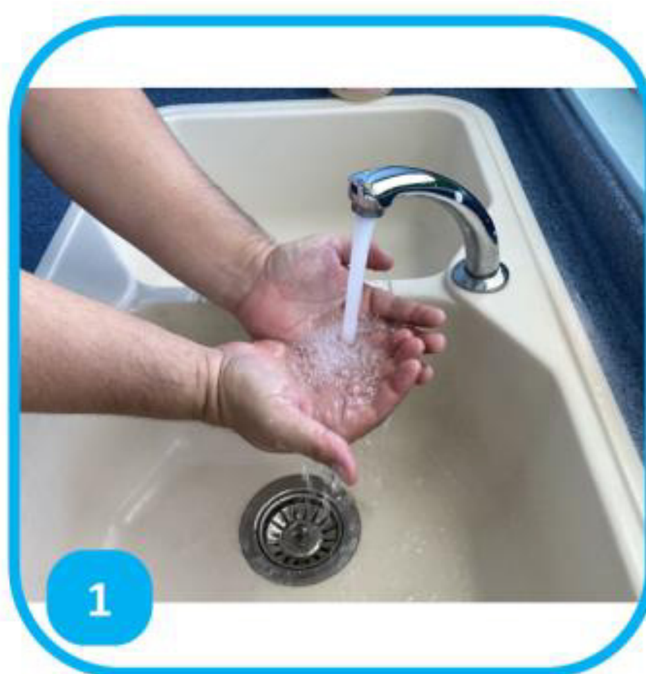
1 Fa'arari i nā rima

'AITA E FAA'UNA'UNA, MAI'U'U POTO, 'AITA E PĒNI