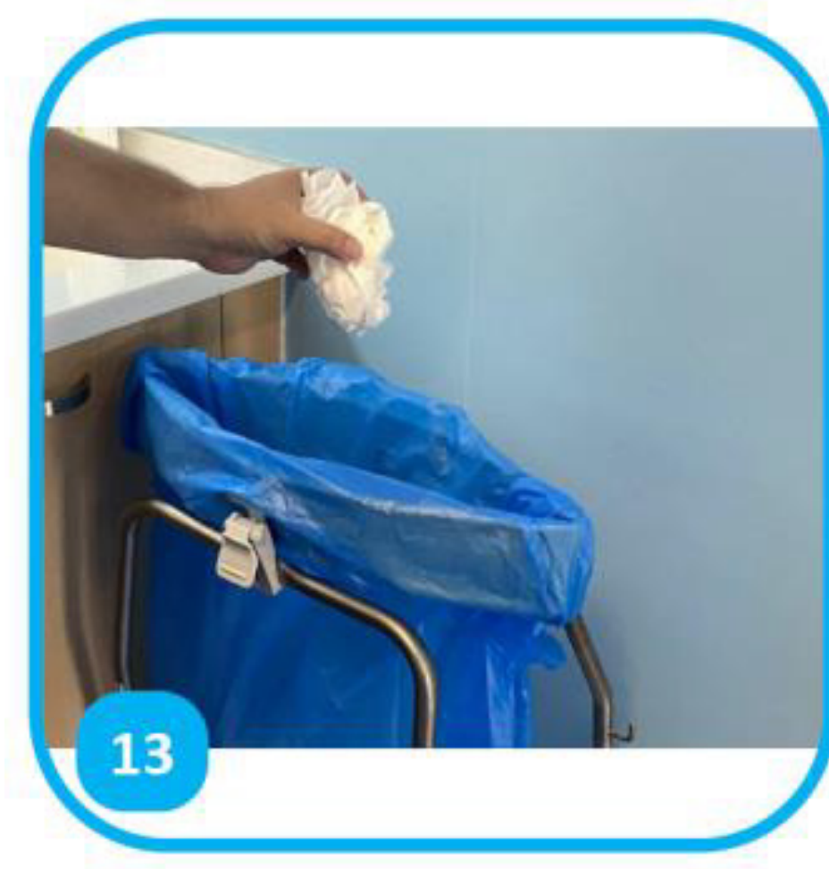
13 Fa'arue te horoi papie i roto i te vaira'a pehu ma te 'ape maite