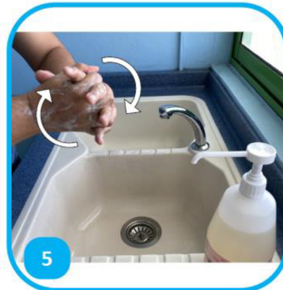
5 Entrelacer les doigts et frictionner