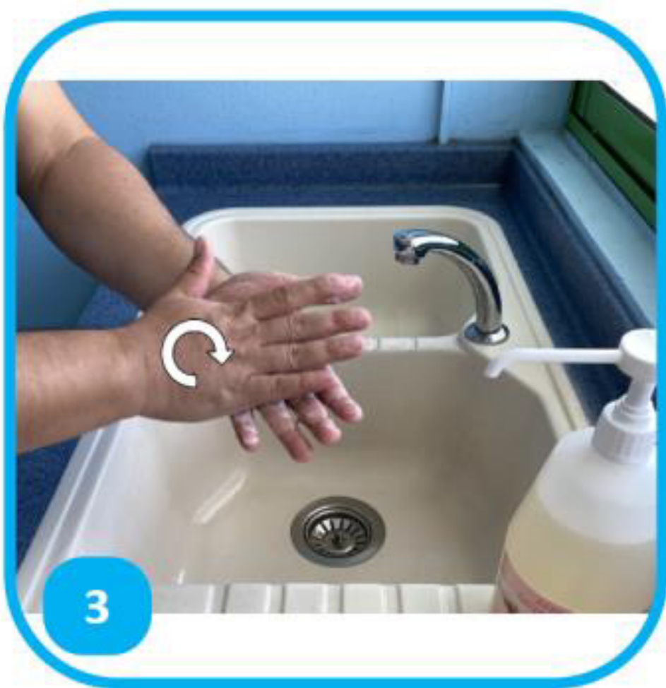
3 Étaler le savon paume contre paume

SANS BIJOUX, SUR ONGLES COURTS, SANS VERNIS