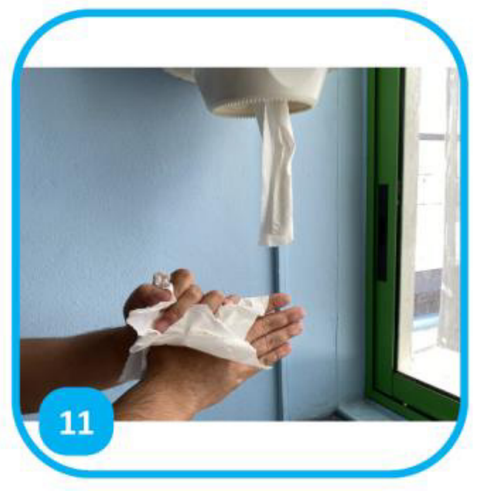
11 Tāmarō ma te rave mai i te horoi papie