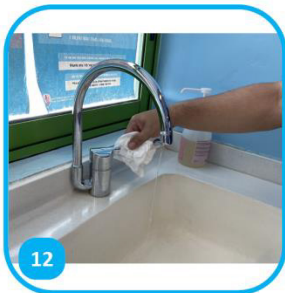
12 Refermer à l'aide de l'essuie-mains