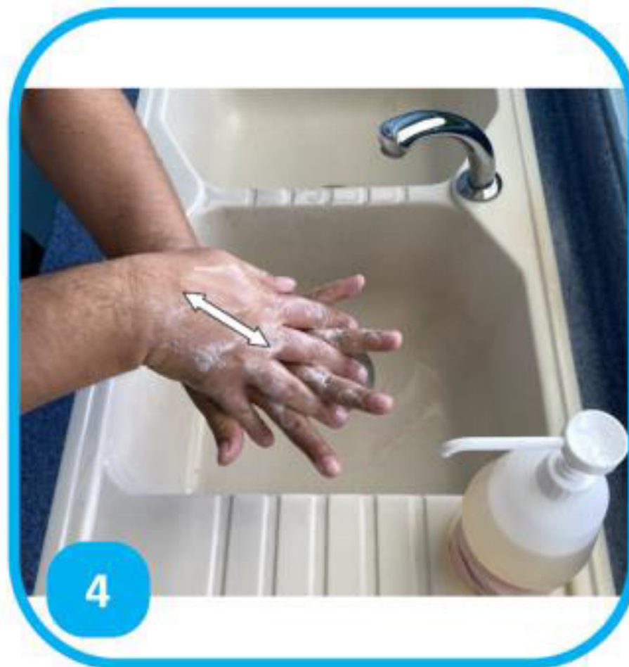
4 Frotter le dos de chaque main