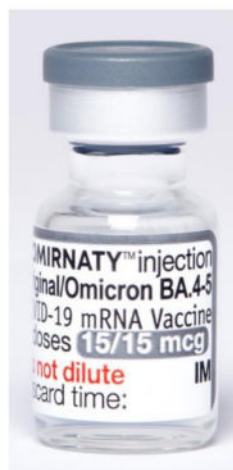
Flacon de vaccin Comirnaty® Original/Omicron BA.4-5, à utiliser en rappel vaccinal, chez les 12 ans et +

Il est recommandé de placer le patient sous surveillance pendant au moins 15 minutes après la vaccination afin de détecter la survenue d'une réaction anaphylactique suivant l'administration du vaccin.