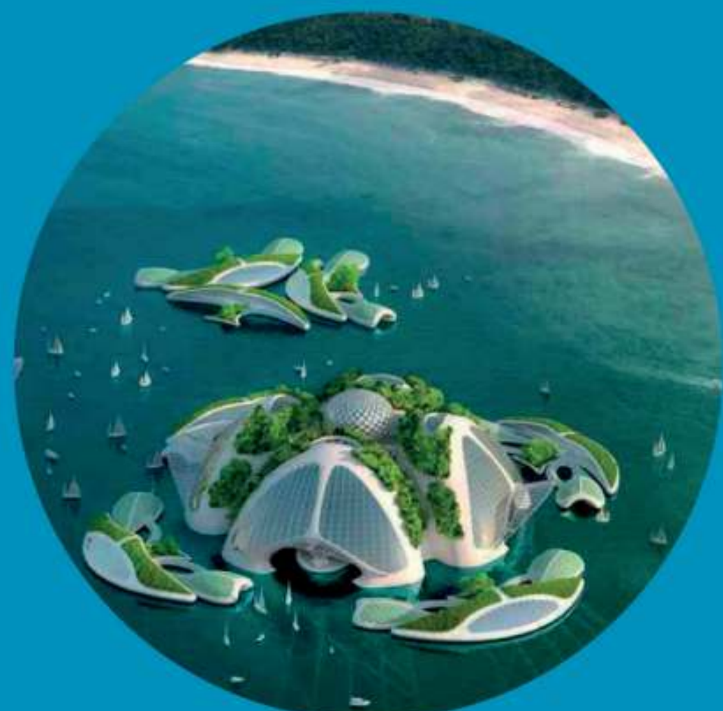
projet de cité flottante

Le projet Aequorea de Vincent Callebaut est un « gratte-océan », véritable village flottant imprimé en 3D grâce à un matériau composite fait d'algues et de déchets plastiques recyclés du « 7ème continent », ou 27 millions de tonnes de débris produits par l'humanité s'entrechoquent, emprisonnés par les courants marins.