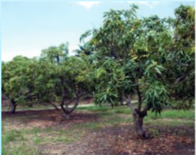
Enherbement entre les manguiers

L'aménagement des terrains est très important. Il permet notamment de limiter l'érosion et la lixiviation du sol , phénomènes courants dans un climat tel que celui de Tahiti. Cela passe notamment par :