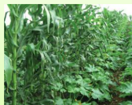
Bordure de maïs autour de cucurbitacées

D'autre part, certaines plantes poussent mieux en association avec d'autres ( plantes compagnons ).