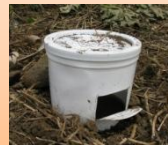
Pièges à charançons