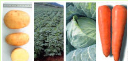
Exemple de rotation de culture

Alterner les cultures d'une année à l'autre au sein d'une même parcelle permet de retarder l'apparition de ravageurs et empêcher leur développement.