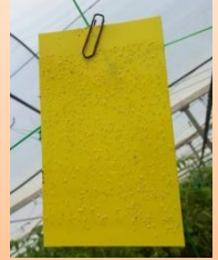
Piège collant pour aleurodes