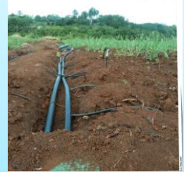
Irrigation au goutte à goutte