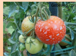
Traitement antifongique bio