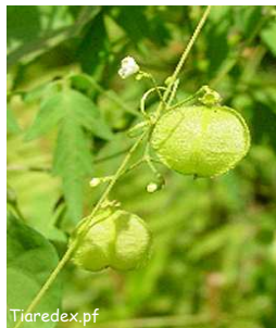
Pois de cœur, vinivinio, vivinio, pomtaou ( Cardiospermum halicacabum , C. grandiflorum )