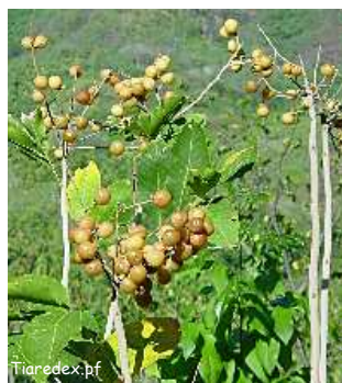
Savonnier, kohouhou, poukokou ( Sapindus saponaria )