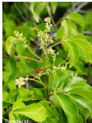
Rama, plante endémique protégée ( Allophylus rhomboidalis )

*Insecticides recommandés: huile de neem, imidachloprid