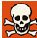
T+ Ta'ero hau T Ta'ero

E tao'a hau i te ataata ia ö i roto i te tino o te taata na te ihu änei, te vaha aore ra te 'iri.