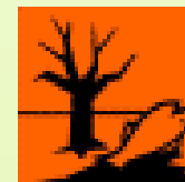
N Ataata no te nätura e te mau mea ora i roto i te pape

E tao'a e 'ama haere noa. 'Eiaha e tuu i piha'i iho i te tao'a ura.